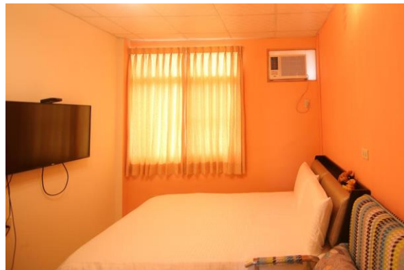
青澀戀曲雙人房 501 定價 1800 元

「嘉義布袋民宿·幸福樂民宿」提供二人房和三人房與 6 人房型，並備有雅房和套房兩種客房，旅人們可以依造需求自由選擇。寬敞、明亮的客房空間供有舒適的床鋪、齊全的衛浴設備和家具設施，潔淨典雅的高品質空間和寧靜舒活的安眠環境，讓旅人們享有極致的樂活舒適。