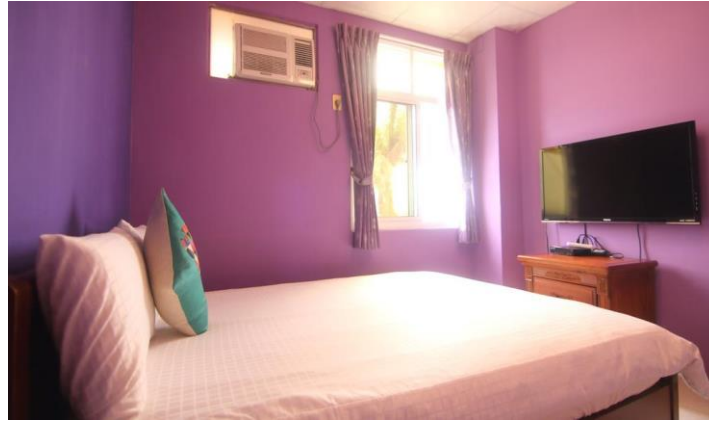
甜甜蜜蜜雙人床 302(雅)定價 1200 元